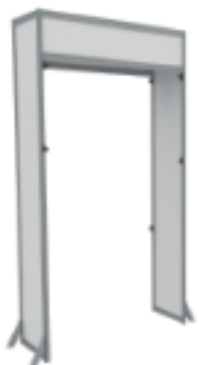
AS-054 | 2.48x1.4x0.54m