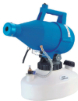
Nebulizador ULV Eléctrico