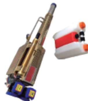
Nebulizador ULV Gasolina