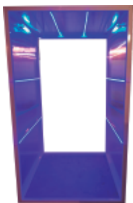
Luz UV Clase C