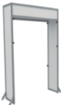
AS-074 | 2.48x1.4x0.74m