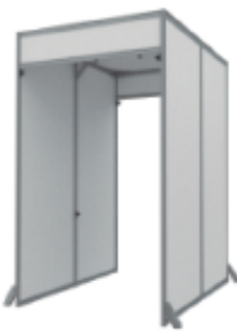
AS-200 | 2.48x1.4x2.00m