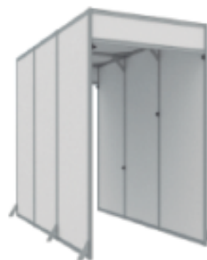
AS-300 | 2.48x1.4x3.00m