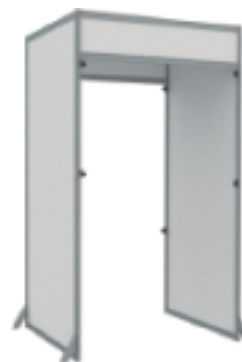
AS-100 | 2.48x1.4x1.00m