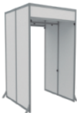
AS-140 | 2.48x1.4x1.40m